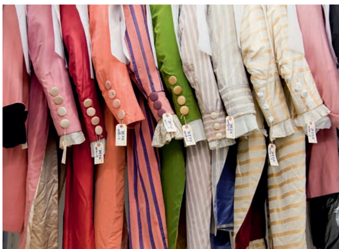
Les réserves du Centre national du costume de scène.