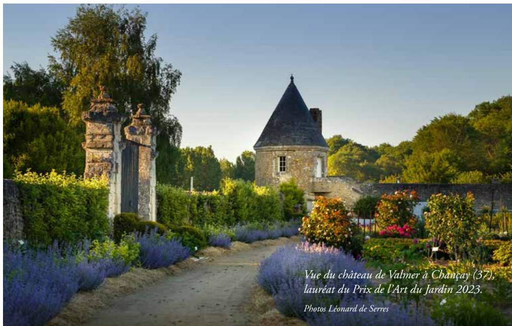
Vue du château de Valmer à Chançay (37), lauréat du Prix de l'Art du Jardin 2023.