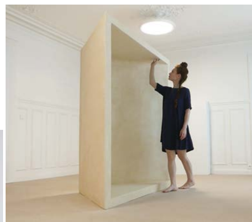
Ci-dessus : For Intérieur, 2020, installation immersive, sculpture.