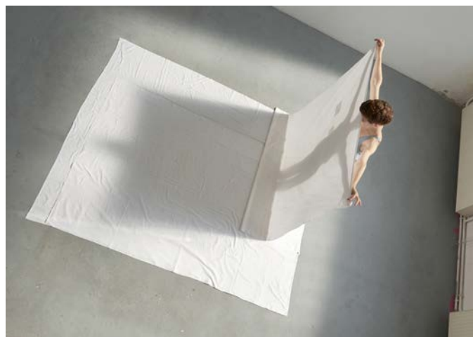
À droite : Le poids du pli, 2014-2017, Jérusalem-Paris, performance.