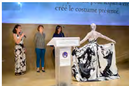
Ci-dessus : le costume créé, grâce au montant du prix, par le Théâtre National de Strasbourg lauréat 2022.