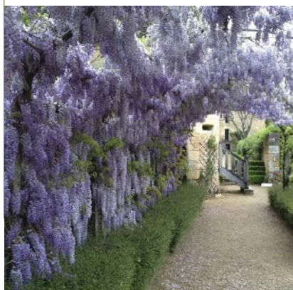
En haut, les jardins et le château de Losse et, à gauche, la tonnelle.