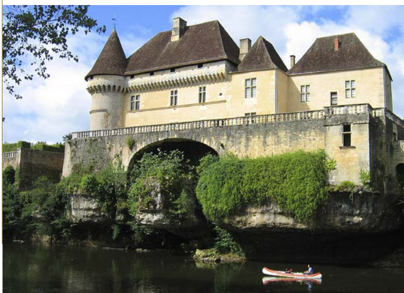
Vues des jardins du château de Losse et de la terrasse qui surplombe la Vézère.