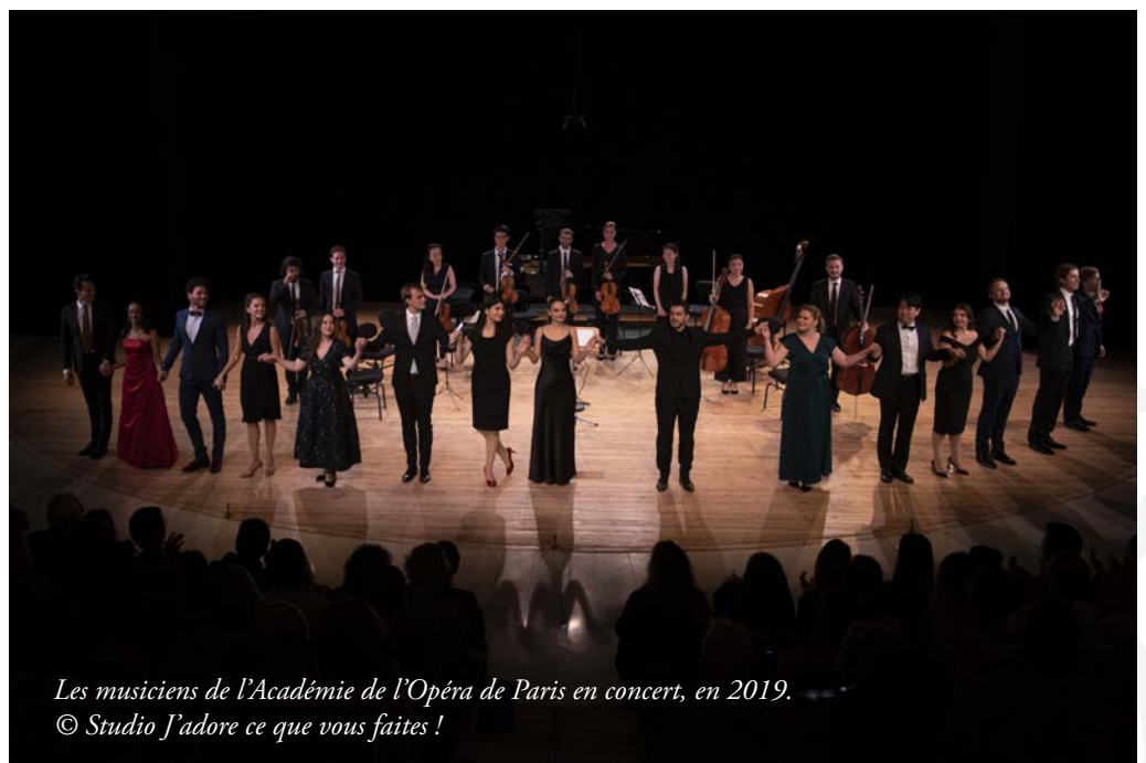
Les musiciens de l'Académie de l'Opéra de Paris en concert, en 2019.