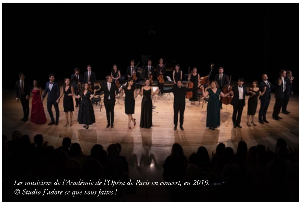
Les musiciens de l'Académie de l'Opéra de Paris en concert, en 2019.