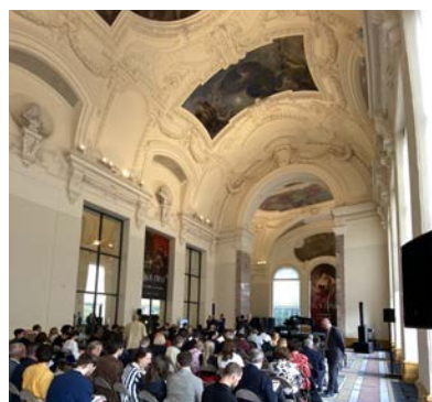
En haut et ci-contre : l'entrée, côté jardin du Petit Palais et la galerie sud dans laquelle se déroulait la cérémonie de remise des Prix.